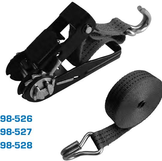
No. 198-526 No. 198-527 No. 198-528

Two heavy duty hooks 15 ft nylon webbing x 1 in. 1500 pounds tensile strength