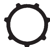
Small 7 spline